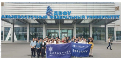
我校学生赴俄罗斯远东联邦大学研学实践

应往届普通高中毕业生，根据高考成绩择优录取。原则上为三表本科录取分数线，可适当降低分数，有特长的学生免于测试并优先录取。