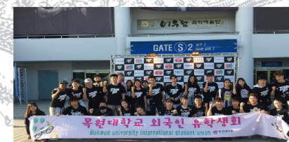
中韩国际班学生留学韩国