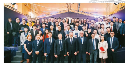
我校学生参加伊尔库茨克国立理工大学 毕业典礼

由中外院校联合制订教学计划，经过半年至一年语言及专业学习，经外方院校在哈尔滨远东理工学院组织的语言测试后赴国外高校留学（4 年）。毕业成绩合格，由外方大学颁发本科毕业证书并授予学士学位。学生信息将报送中国教育部留学服务中心和俄罗斯、韩国教育部备案。学生归国后，学校可统一组织学生到教育部留学服务中心办理学历认证事宜（认证费自理）。